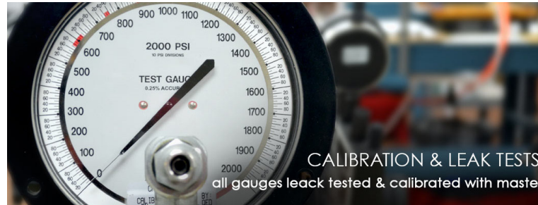
CALIBRATION & LEAK TESTS all gauges leak tested & calibrated with master