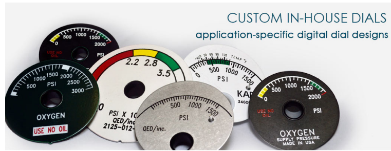
CUSTOM IN-HOUSE DIALS application-specific digital dial designs