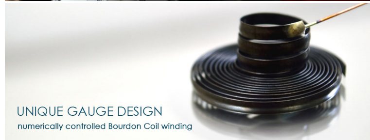
UNIQUE GAUGE DESIGN numerically controlled Bourdon Coil winding